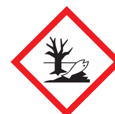
Schadelijk voor het milieu